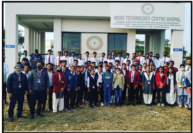
Industrial Training at MSME Technology centre, Bhopal