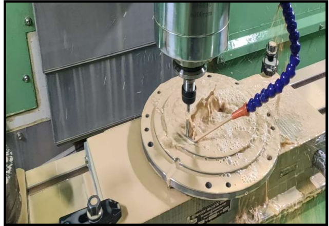
Components Developed at MSME Technology centre, Bhopal