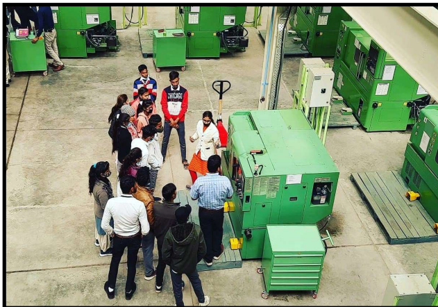
Training workshop at MSME Technology centre, Bhopal